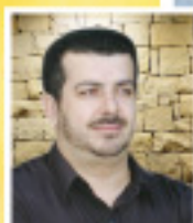
Γράφει ο ΜΙΧΑΛΗΣ Μ. ΜΙΝΟΥΔΑΚΗΣ

Διεσάθη, στα δικά μου μάτια τουλάχιστον, το "αποκορωνιώτικο κοινωνικό" αφού και φέτος απείχε από καρναβαλικές φιέστες. Όποιος και εάν ήταν ο λόγος, το αποτέλεσμα ήταν να μη "συναναστραφούμε" ως επιμέρους συνιστώσα των Χανίων, ως αυριανός Δήμος Αποκορώνου, τα προσώπια, τον Καρνάβαλο, την καύση, τη σάμπα και τον παραλαγισμό. Είναι σφοδρή να σμίγουν οι άνθρωποι λένε ορισμένοι. Έ, και: Οι άνθρωποι ως σμίγουν για τον καλό σκοπό και όχι ως θυματοποιημένες, μεταμορφωμένες υπο-υπάρξεις της παγκοσμιοποιημένης φεστο-βλακείας. Προσωπικές, ασφαλώς, απόψεις όλα τούτα. Που βρήκαν, την αποκορωνιώτικη αποχή από καρνάβαλο-διοργανώσεις, ως ευκαιρία, για να δημοσιοποιηθούν.